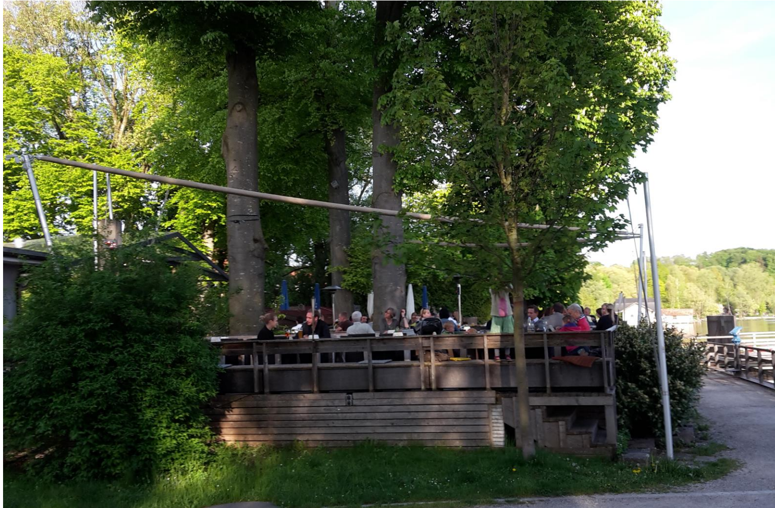
Der schönste Ort am See mit eingefahrener Markise